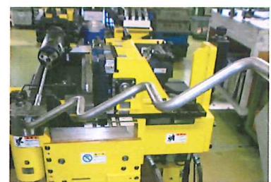
ステンレス管の曲げ・端末加工

従来、少品種大量生産向けであった製造ラインを、高性能なパイプ曲げ加工機等の設備導入により、多品種少量生産態勢に移行。この結果、銅管から加工難易度が高いステンレス管までの対応が可能となり、給湯器配管に係る売上高が約5%向上した。また、2016年から5年計画で、工場内の機器や設備の全体をネットワークで相互接続するIoT化を実施中。取引先ごとに様式の異なる受注データを取り込み、ライン毎の生産計画を自動作成し、受注から生産までを一貫して管理するシステムの開発を目指す。