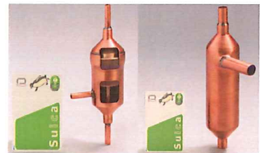
表面張力式・遠心力式 気液分離器

難易度が非常に高く、ノウハウを持つ企業が少ない分野の技術を獲得することにより、市場競争力の強化、自社ブランド力の向上を図り、付加価値の確保につなげている。そのために、独自製品の研究開発に継続して取り組んでおり、現在は次世代自動車の燃料電池等で使用される「気液分離器」に注力している。また、加工設備や研究開発用の試験装置等を自社で開発・製造する技術を有することも強みであり、自由度の高い設備・装置の導入を低コストで行うことで高い付加価値を生み、他社との差別化を図っている。