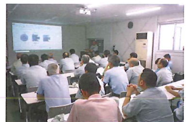
小集団活動の発表会

外部環境により生じる繁閑の波に対応可能な態勢を整備すべく、従業員の多能工化を促進するための教育訓練について、年間計画を立案し実施している。また、従業員間での技術・情報の共有化・承継については、自社の製造設備や独自加工技術の開発に係るノウハウを「技術検討書」としてまとめ、定期的な発表会を持つことや、各現場で小集団活動を実施し、チームで課題を議論して解決した結果を、中間期末に幹部社員の前で発表させる等の取組によって推進し、従業員の成長を図っている。